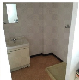
洗面台&amp;室内洗濯機置場