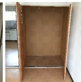
洋室クローゼット