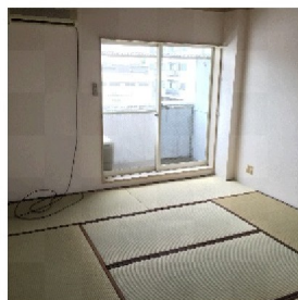
8畳和室 (エアコン付)