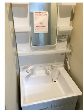
シャワー付き洗面化粧台